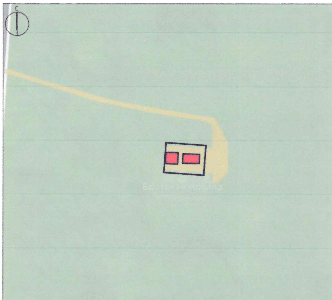
Схема предмета охраны объекта культурного наследия регионального значения «Братская могила воинов Советской Армии, погибших в период Великой Отечественной войны», 1941 –1945 гг., расположенного по адресу: Курская область, Рыльский район, село Ивановское

Используемые условные знаки и обозначения: