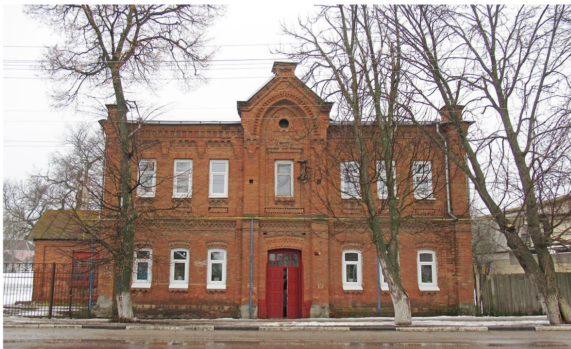
Главный фасад объекта культурного наследия «Земский Дом арестуемых». Фото 2022.

Согласно утвержденному предмету охраны «все фасады имеют композицию, стремящуюся к симметрии, выполнены в открытом полихромном кирпиче оттенков красного, песочного (охра), серого, в т.н. «кирпичном стиле», формах стилизаций периода историзма с акцентом на самобытность народной архитектуры южно-порубежных районов России 2-й половины XIX в. и рубежа XIX-XX вв.». С юга и запада к дворовым фасадам здания примыкают небольшие одноэтажные поздние дисгармоничные пристройки.