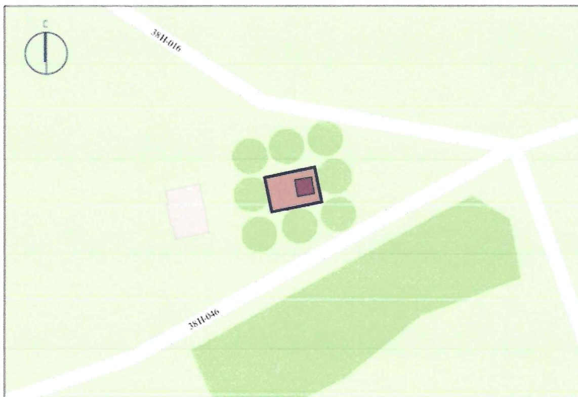
Схема предмета охраны объекта культурного наследия регионального значения «Братская могила воинов Советской Армии, погибших в феврале 1943 года», 1943 г., расположенного по адресу: Курская область, Золотухинский район, Ануфриевский сельсовет, с. Ануфриевка (в центре села)