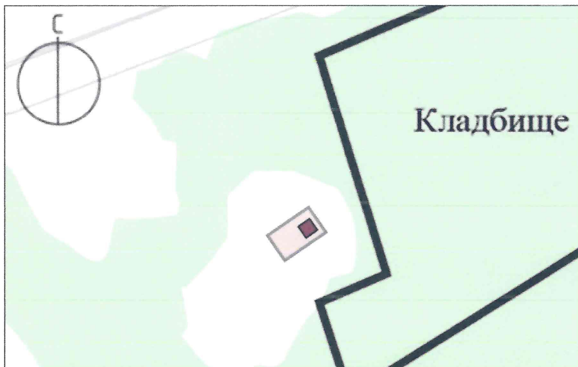
Схема предмета охраны объекта культурного наследия регионального значения «Братская могила воинов Советской Армии, погибших в феврале 1943 года. Захоронено 425 человек, установлено фамилий на 113 человек. Скульптура установлена в 1963 году», 1943 г., расположенного по адресу: Курская область, Золотухинский район, Ануфриевский сельсовет, село Нижний Даймен (в начале села справа с южной стороны кладбища)