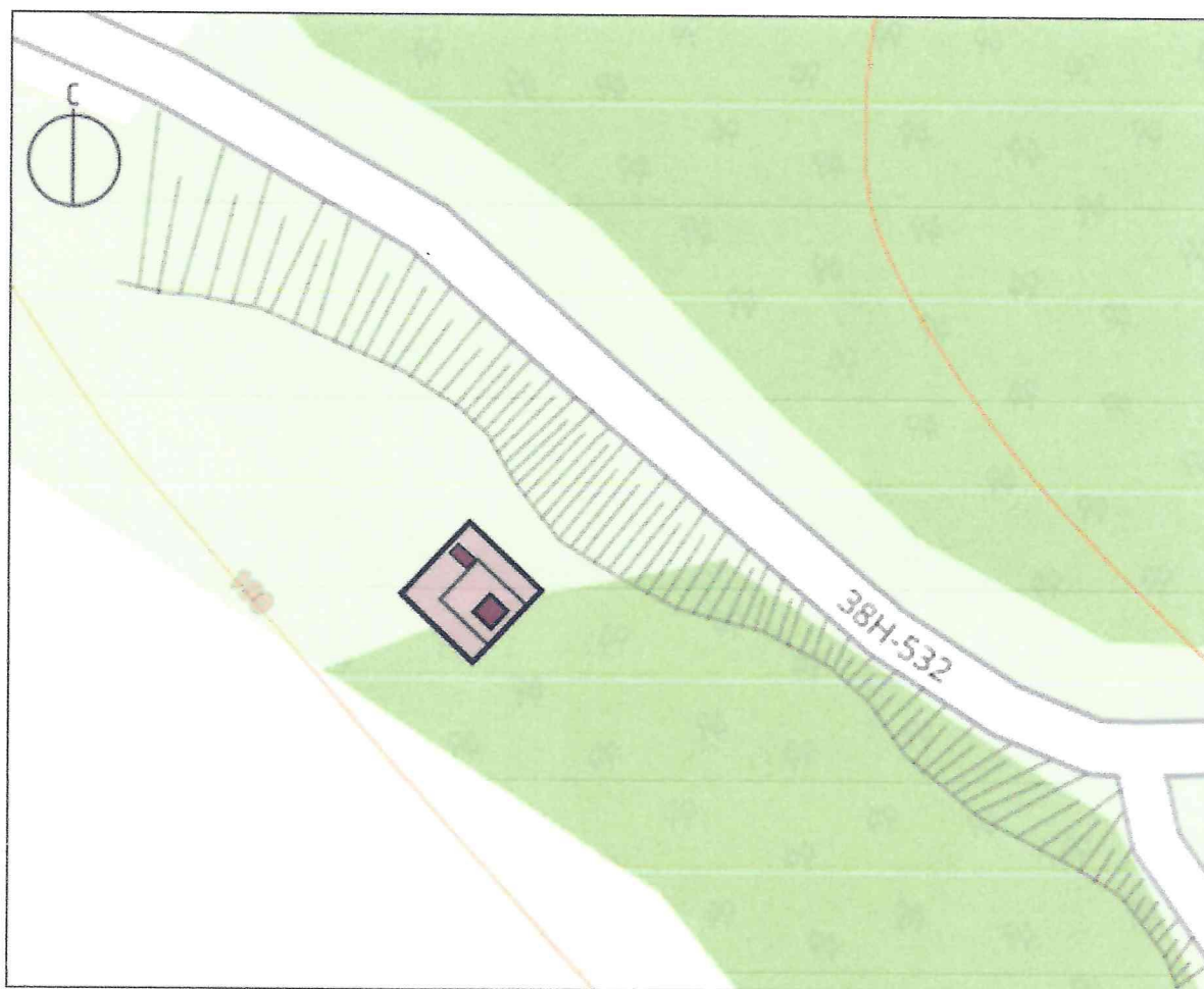
Схема предмета охраны объекта культурного наследия регионального значения «Братская могила воинов Советской Армии, погибших в феврале 1943 года», 1943 г., 1963 г., расположенного по адресу: Курская область, Золотухинский район, с. Новоспасское