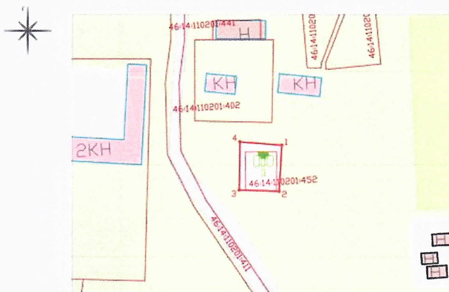
Границы территории объекта культурного наследия