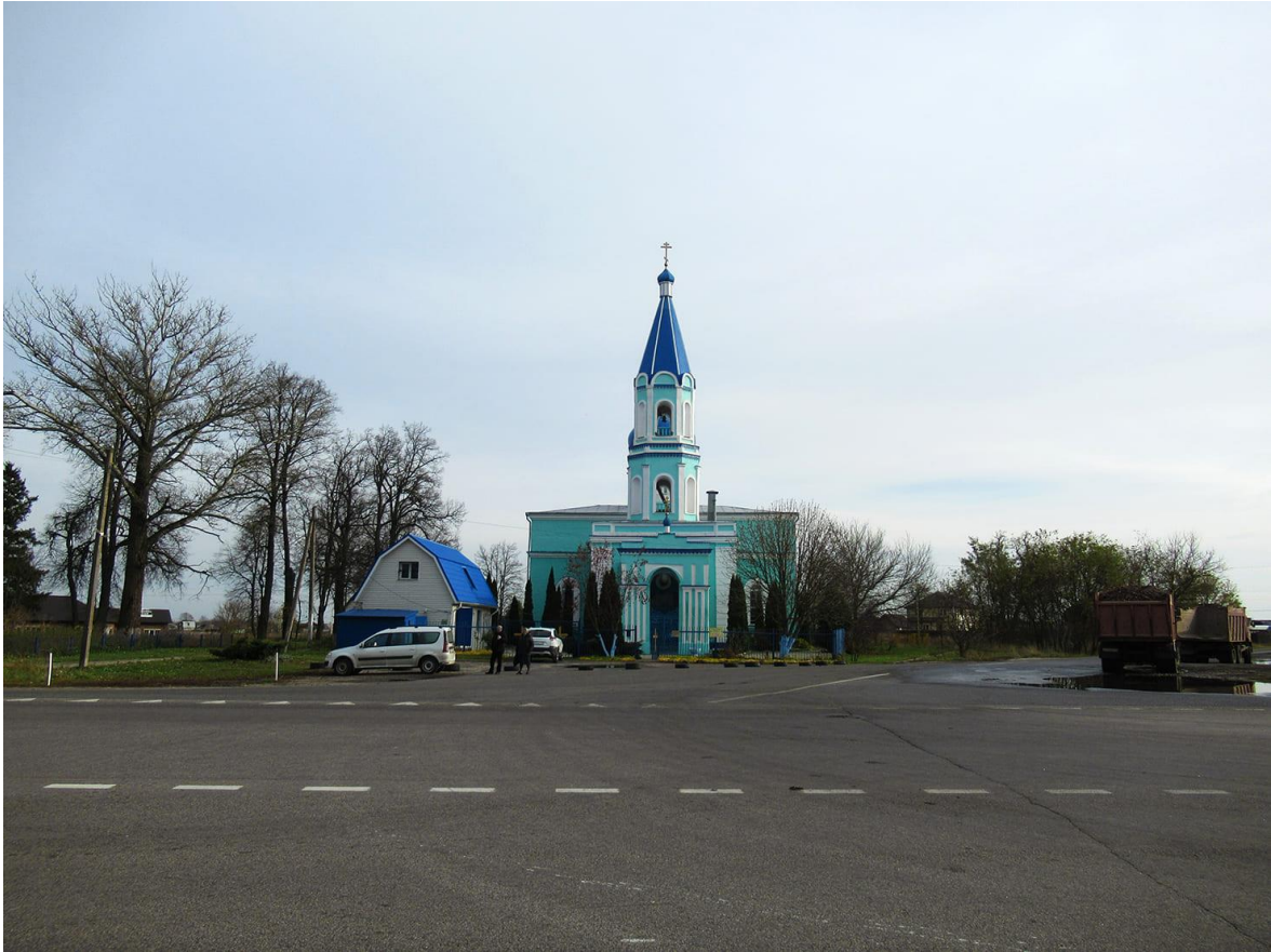
«Церковь Троицкая», 1877 г. Вид с северо-запада. (Фотофиксация из проектной документации)

Предположительно Троицкая церковь была построена по проекту архитектора В. Моргана. Храмовая часть церкви в точности соответствует одному из его типовых проектов, изданных в специальном альбоме, но в сравнении с типовым проектом композиция храма дополнена трапезной, колокольной и гульбищем. По проекту В. Моргана церковь - пятиглавая. Возможно, четыре малые главы Троицкого храма были утеряны со временем.