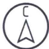
Схема предмета охраны объекта культурного наследия регионального значения «Братская могила воинов Советской Армии, погибших в период Великой Отечественной войны. Захоронено 116 человек, установлено фамилий на 51 человека. Скульптура установлена в 1952 году», 1941–1945 гг., 1952 г., расположенного по адресу: Курская область, Пристенский район, село Пристенное (100 м юго–восточнее правления колхоза и сельского Совета)