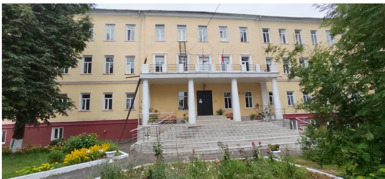
Фото 1. Выявленный объект культурного наследия «Тюрьма, кон. XVIII - нач. XIX».

В ходе разработки Раздела были проведены историко-градостроительные и натурные исследования; оценена современная градостроительная ситуация на участке проектирования и прилегающей местности; выполнен анализ действующей градостроительной документации и ограничений в области охраны объектов культурного наследия; произведена оценка воздействия проводимых работ на выявленный объект культурного наследия регионального значения: «Раздел, по обеспечению сохранности выявленного объекта культурного наследия «Тюрьма, кон. XVIII - нач. XIX» (Курская область, г. Дмитриев, пл. Базарная, 13), разработан необходимый перечень мероприятий, предотвращающих воздействие на Объект при реконструкции здания столовой, расположенной по адресу: Курская область, Дмитриевский район, г. Дмитриев, пл. Базарная, дом 13, как на физическую сохранность объекта культурного наследия, так и на сохранение условий его визуального восприятия в историко-градостроительном и природном окружении.