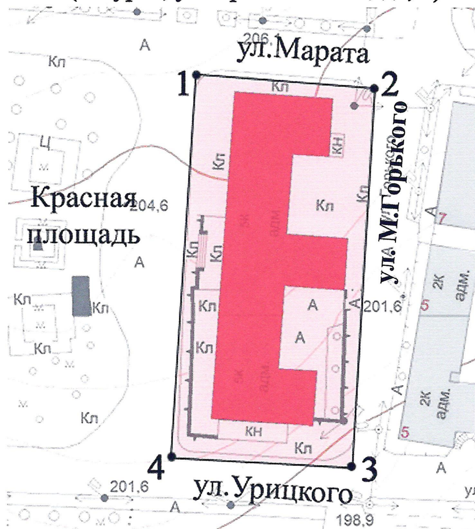
Схема границ территории объекта культурного наследия регионального значения «Дом Советов» (г. Курск, ул. Красная Площадь, 1)