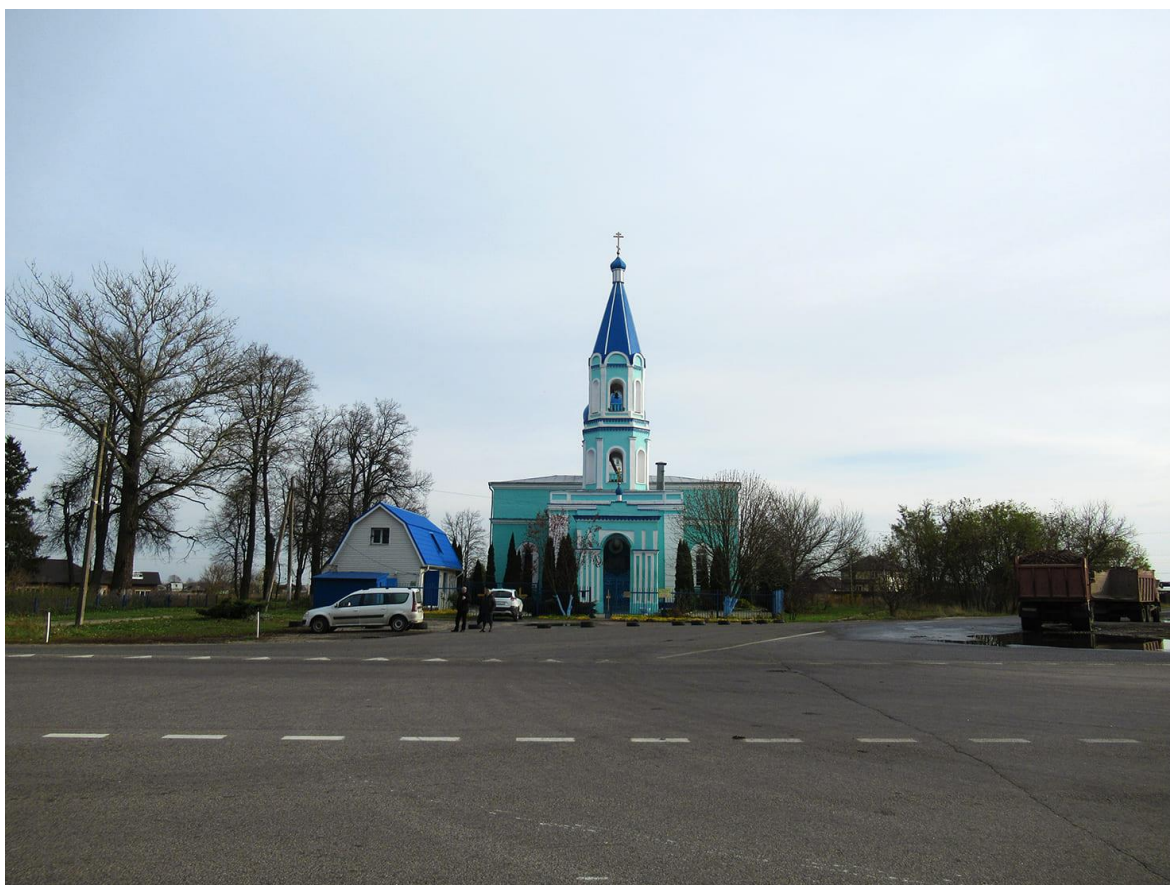
«Церковь Троицкая», 1877 г. Вид с северо-запада.

Предположительно Троицкая церковь была построена по проекту архитектора В. Моргана. Храмовая часть церкви в точности соответствует одному из его типовых проектов, изданных в специальном альбоме, но в сравнении с типовым проектом композиция храма дополнена трапезной, колокольной и гупбищем. По проекту В. Моргана церковь - пятиглавая. Возможно, четыре малые главы Троицкого храма были утеряны со временем.