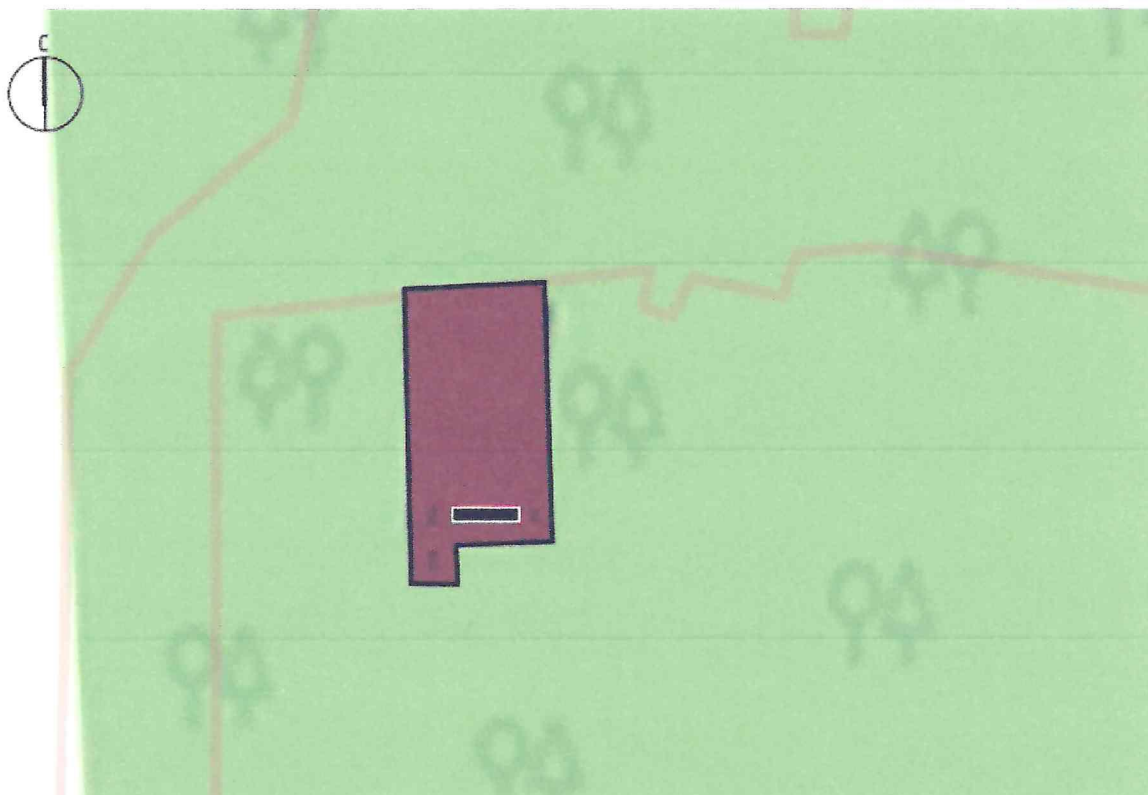
Схема предмета охраны объекта культурного наследия регионального значения «Братская могила воинов Советской Армии, погибших в феврале 1943 года. Захоронено 193 человека, установлено фамилий на 34 человека. Обелиск установлен в 1953 году», 1943 г., 1953 г., расположенного по адресу: Курская область, Железногорский район, село Андросово (на гражданском кладбище)