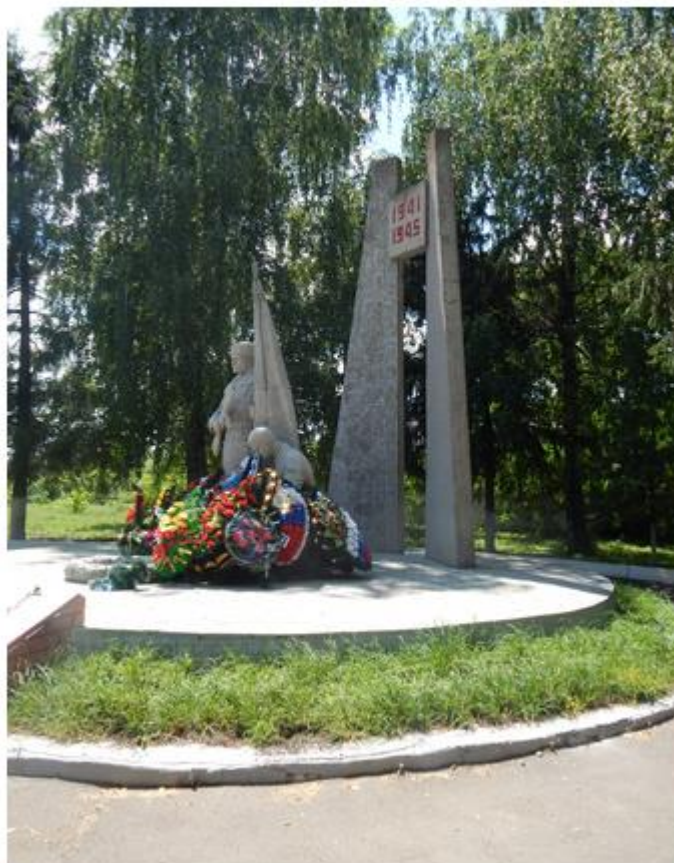
Рис.4. Общий вид объекта культурного наследия регионального значения «Братская могила воинов Советской Армии, погибших в январе 1943 года» по адресу: Курская область, Горшеченский район, п. Горшечное.

Краткие исторические сведения о выявленном объекте культурного наследия «Церковь Св. Николая, XIX в.», по адресу: Курская область, Горшеченский район, п. Горшечное, ул. Первомайская, 45 б (по материалам, представленным в экспертируемом разделе)