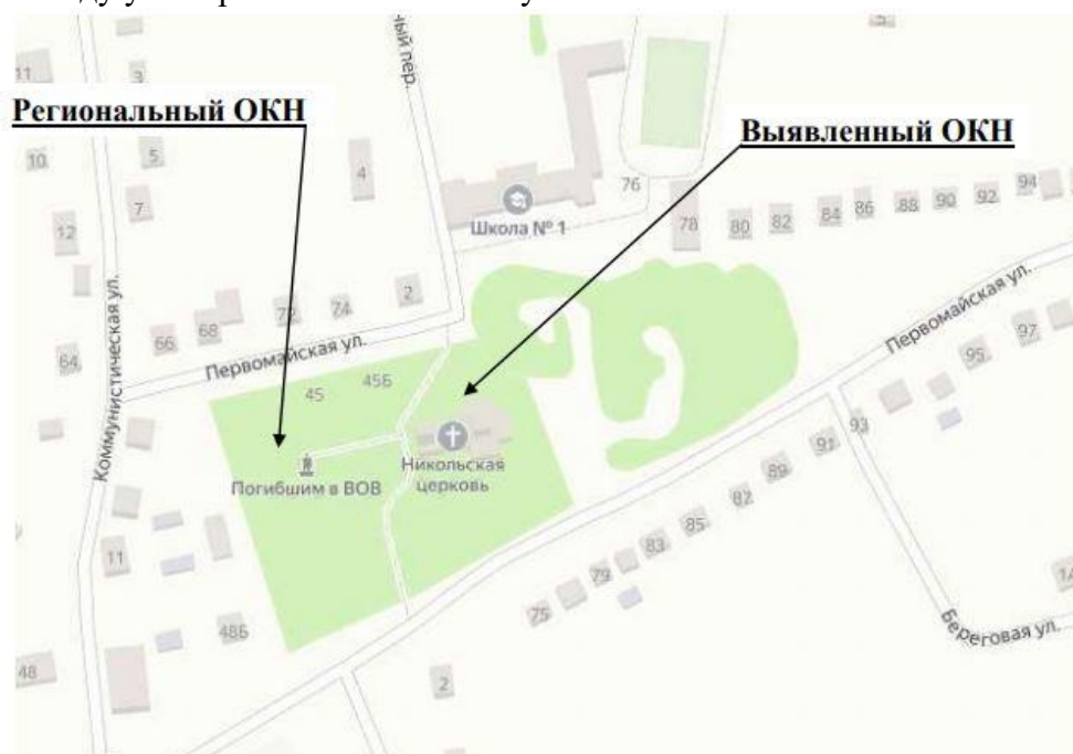
Рис.1. Ситуационный план объекта культурного наследия регионального значения «Братская могила воинов Советской Армии, погибших в январе 1943 года» (Курская область, Горшеченский район, п. Горшечное); выявленного объекта культурного наследия «Церковь Св. Николая, XIX в.» (Курская область, Горшеченский район, п. Горшечное, ул. Первомайская, 45 б).

Как указано в разделе 3 «Краткие исторические сведения о территории проектирования» экспертируемой документации территория исследования расположена центральной части п. Горшечное Горшеченского района Курской области, на озелененной территории между ул. Первомайской и Коммунистической.