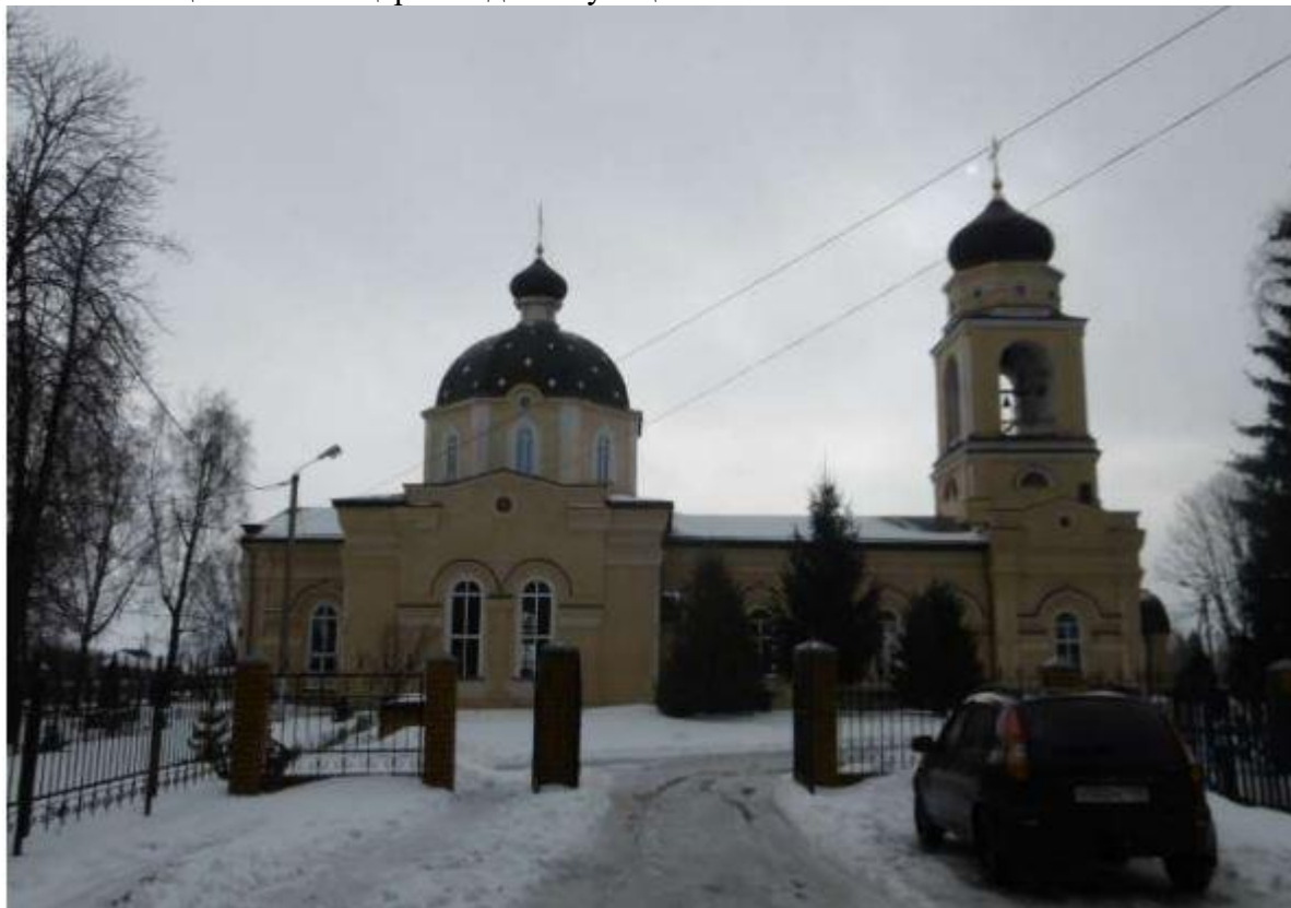
Рис.5. Выявленный объект культурного наследия «Церковь Св. Николая, XIX в.», по адресу: Курская область, Горшеченский район, п. Горшечное, ул. Первомайская, 45 б.

Экспертируемый раздел разработан в целях обеспечения сохранности объекта культурного наследия регионального значения «Братская могила воинов Советской Армии, погибших в январе 1943 года», (Курская область, Горшеченский район, п. Горшечное) и выявленного объекта культурного наследия «Церковь Св. Николая, XIX в.», (Курская область, Горшеченский район, п. Горшечное, ул. Первомайская, 45б) при проведении работ по проекту «Благоустройство территории объекта культурного наследия регионального значения «Братская могила воинов Советской Армии, погибших в январе 1943 г.» Согласно проектной документации, участок для проектирования расположен в поселке Горшечное Горшеченского района Курской области в жилой застройке, параллельно ул.Первомайская. С восточной стороны от участка располагается выявленный объект культурного наследия «Церковь Св.Николая, XIX в.