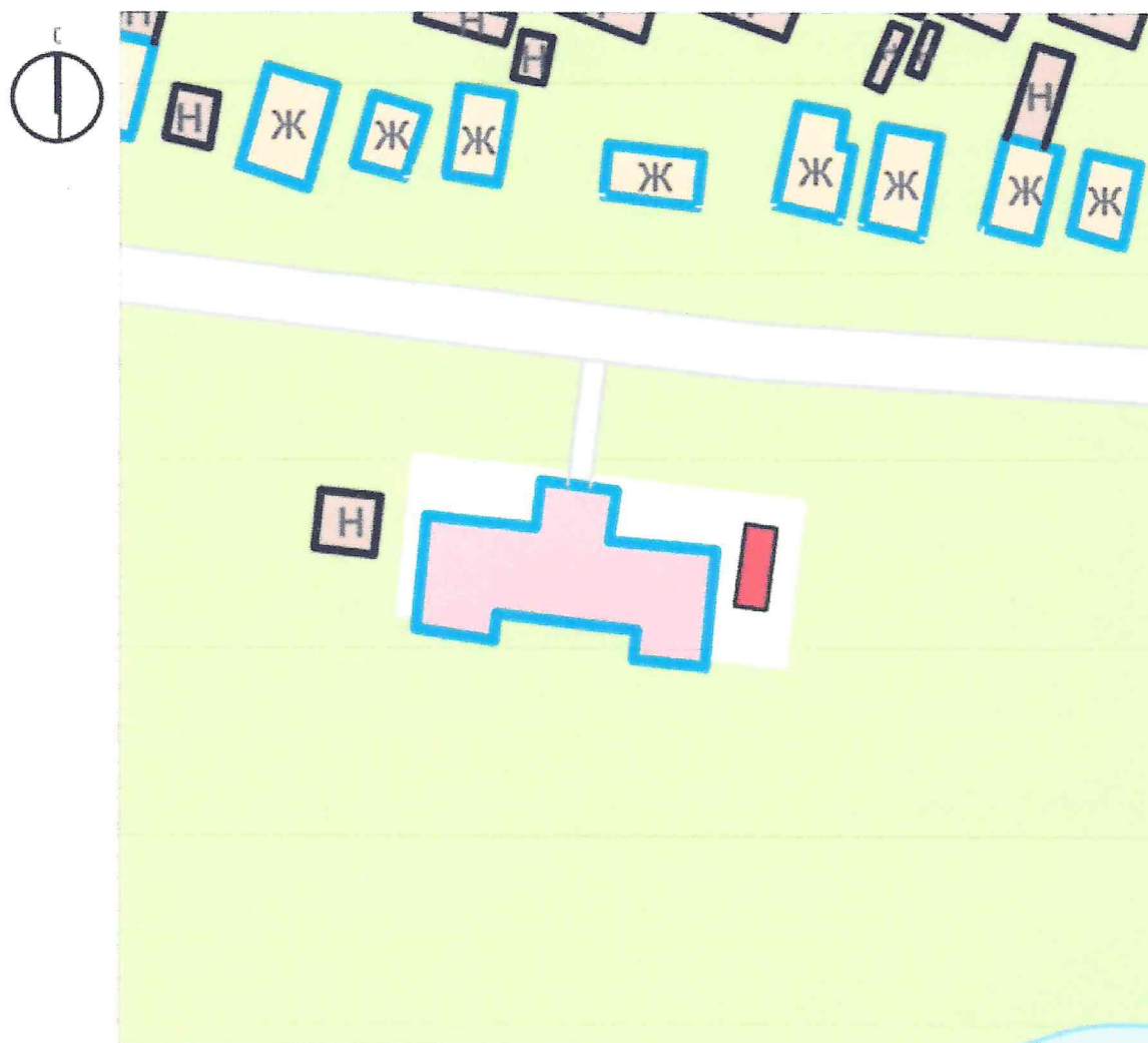
Схема предмета охраны объекта культурного наследия регионального значения «Братская могила воинов Советской Армии, погибших в период Великой Отечественной войны. Захоронено 13 человек, установлено фамилий на 4 человека. Скульптура установлена в 1958 году», 1958 год, расположенного по адресу: Курская область, Рыльский район, село Локоть (в центре села), у Дома культуры

Используемые условные знаки и обозначения: