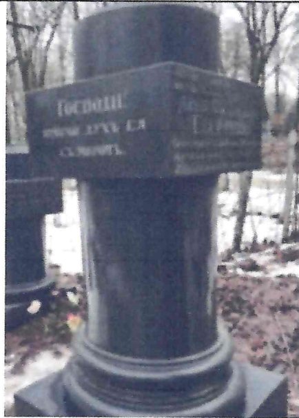
Вид на памятник с лицевой и правой сторон