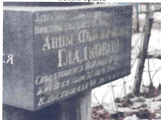
Текст мемориальной надписи на лицевой стороне