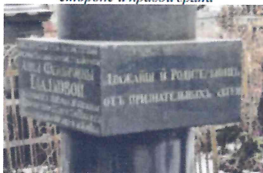
Текст мемориальной надписи на левой грани