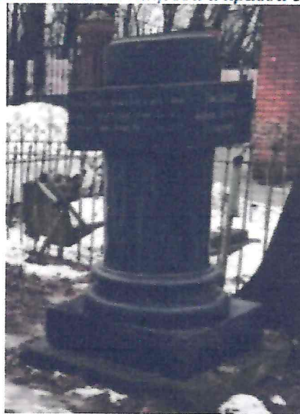
Вид на памятник с тыльной стороны и на левую грань