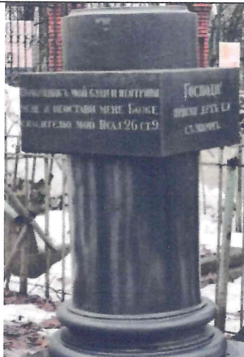
Текст мемориальной надписи на тыльной стороне и правой грани