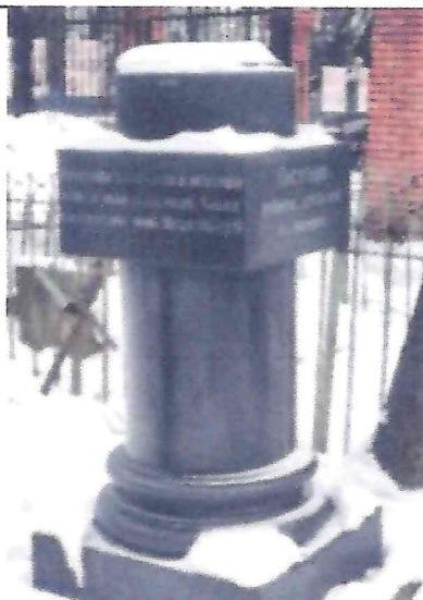
материал: черный мрамор; габариты, конфигурация, материал, оформление