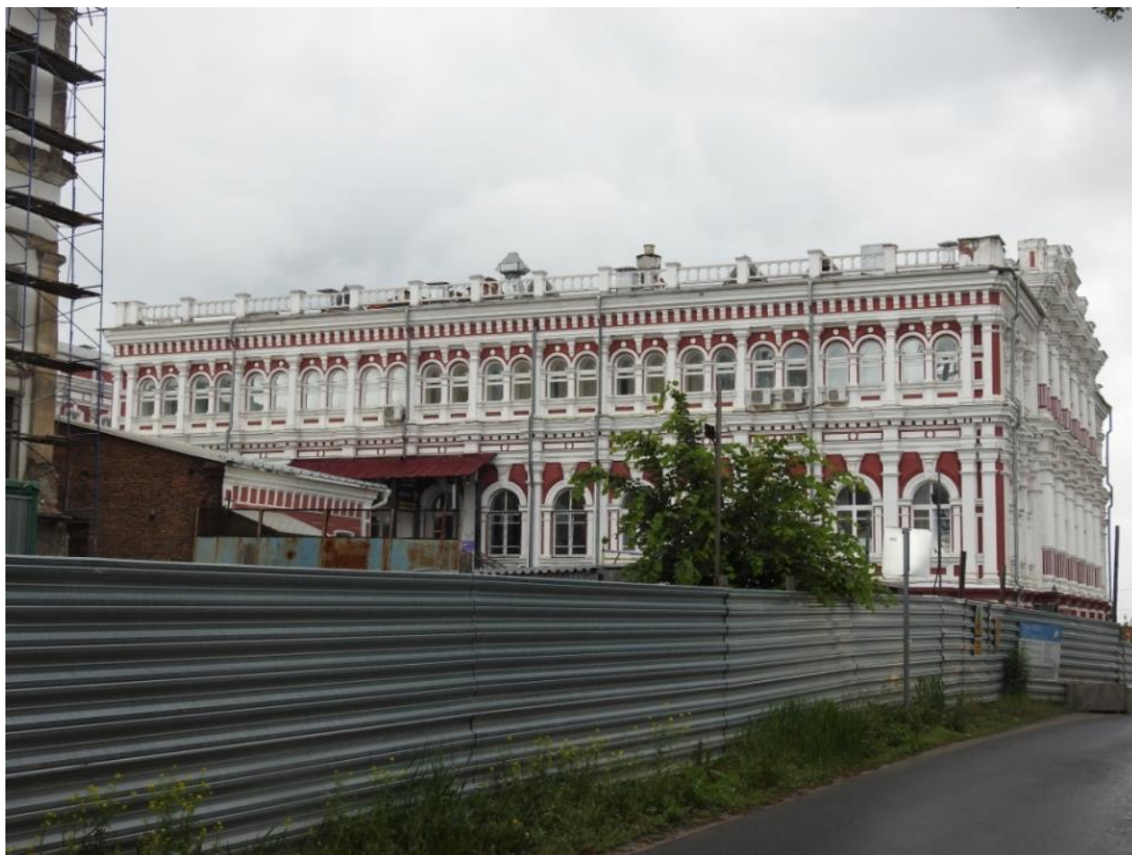
Общий вид юго-западного фасада