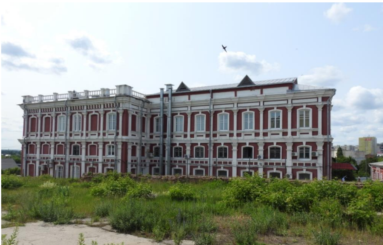
Фасад здания со стороны Знаменского монастыря