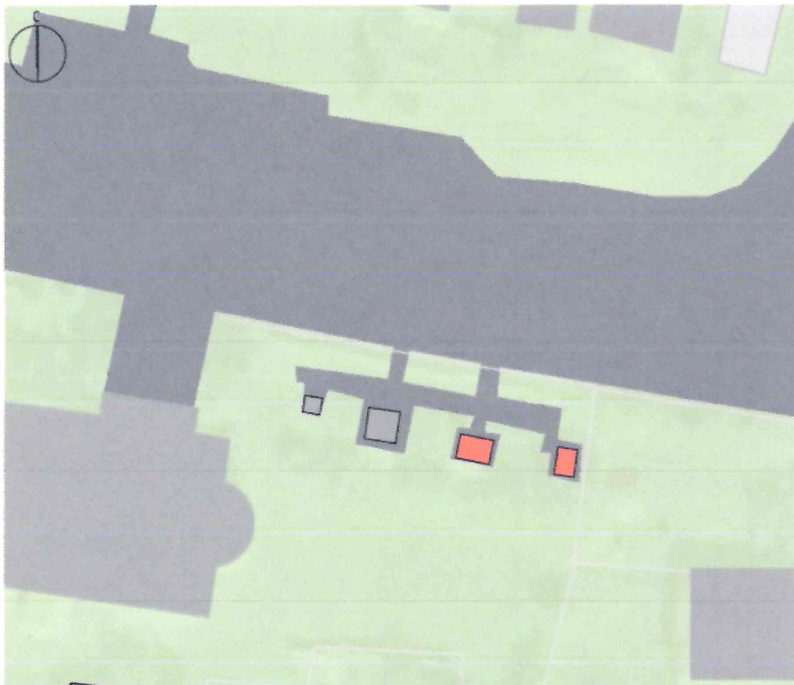
Схема предмета охраны объекта культурного наследия регионального значения «Братская могила воинов Советской Армии, погибших в период Великой Отечественной войны», 1941–1945 гг., расположенного по адресу: Курская область, Рыльский район, Крупецкий сельсовет, д. Рыжевка

Используемые условные знаки и обозначения: